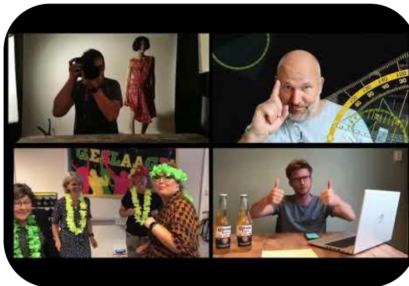
Mentor in de klas